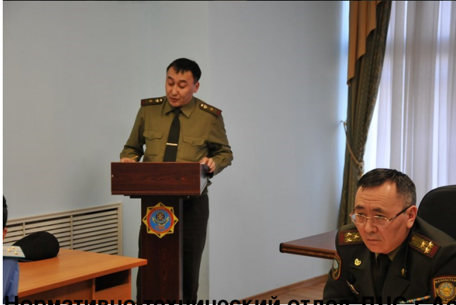
Нормативно-технический отдел ДЧС г.Астаны